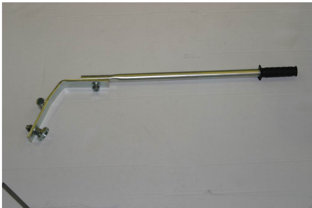
Levá strana - detail montáže svorky GEOSTONE.